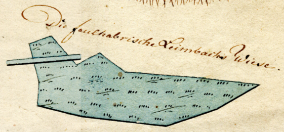
Die koenigliche Leinbacher Wiese.

Maasstab von 50 Ruthen, deren eine 16 Koenigsberger Schuch lang ist, enthaelt und worin 160 Auen Morgen ausmachen.