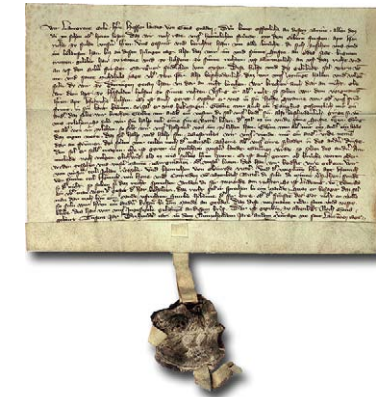
Urkunde Ottos I. vom 6. August 1319 im Modul „Regesten der Landgrafen von Hessen“

Zu den besonderen Eigenschaften von LAGIS gehören die verschiedenen Recherchemöglichkeiten. Bei der einfachen Suche kommen Technologien zum Einsatz, wie sie auch in Suchmaschinen verwendet werden. Die Registersuche eröffnet eher explorativ orientierte Zugänge: über alphabetische Indizes dient sie nicht