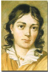
Bettina von Arnim im Modul „Hessische Biografie“

Das Landesgeschichtliche Informationssystem Hessen LAGIS ist ein wissenschaftliches Web-Angebot des Hessischen Landesamts für geschichtliche Landeskunde (Marburg), einer Dienststelle des Hessischen Ministeriums für Wissenschaft und Kunst . Das System wird seit 2004 vom Landesamt – auch in enger Kooperation mit Mitarbeiterinnen und Mitarbeitern aus anderen Einrichtungen – entwickelt und betrieben.